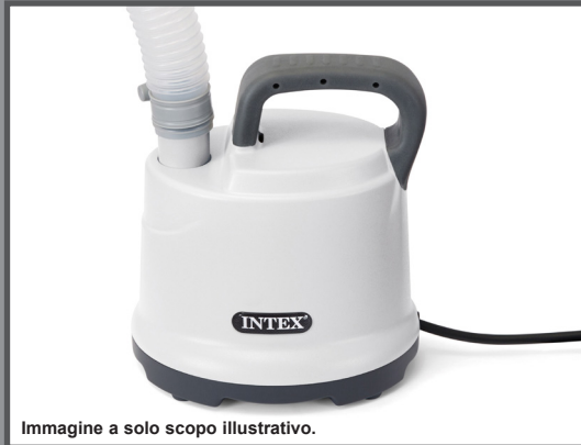
Immagine a solo scopo illustrativo.

POMPA DI DRENAGGIO Modello DP30220 220 - 240V~, 50Hz, 99W Hmax 2.5 m, Hmin 0.01 m, IPX8